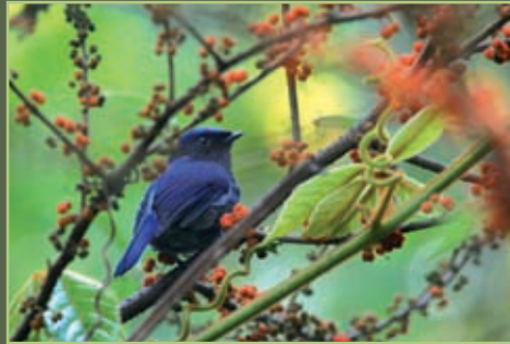
Gobemouche de MacGregor