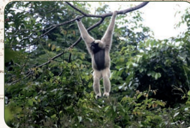
Gibbon à bannet