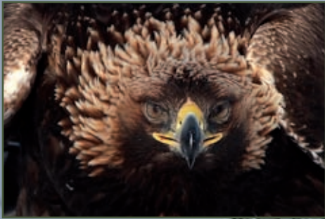
Portrait d'Aigle royal