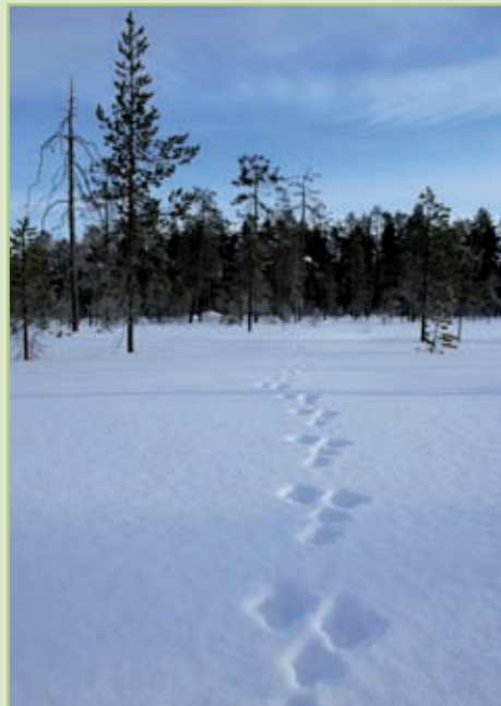
Traces de lièvre variable