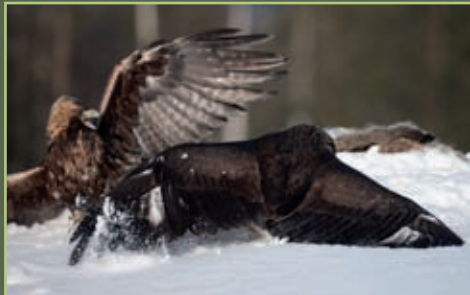
Combat d'aigles royaux